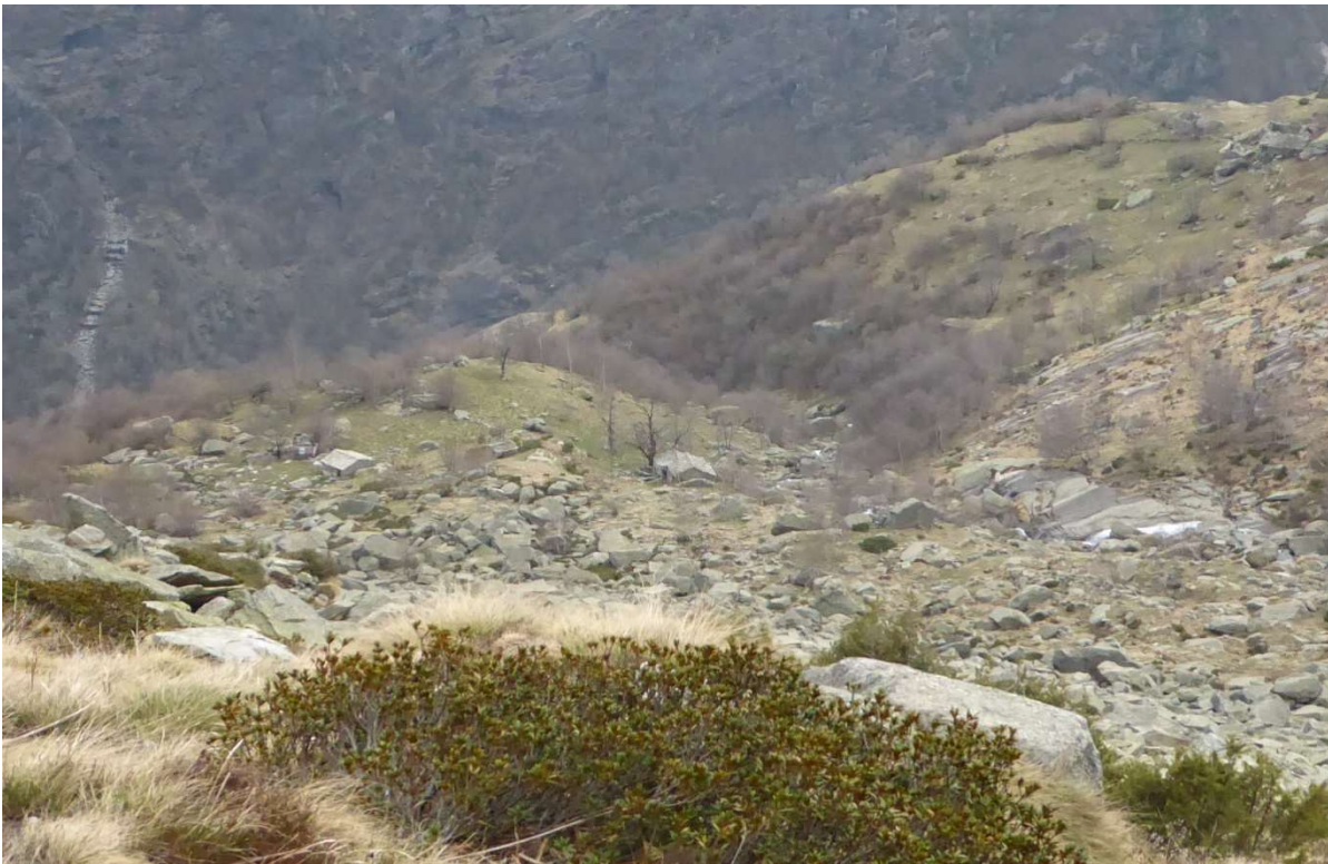
Alpe Orti e Alpe Ges viste dall' alto.