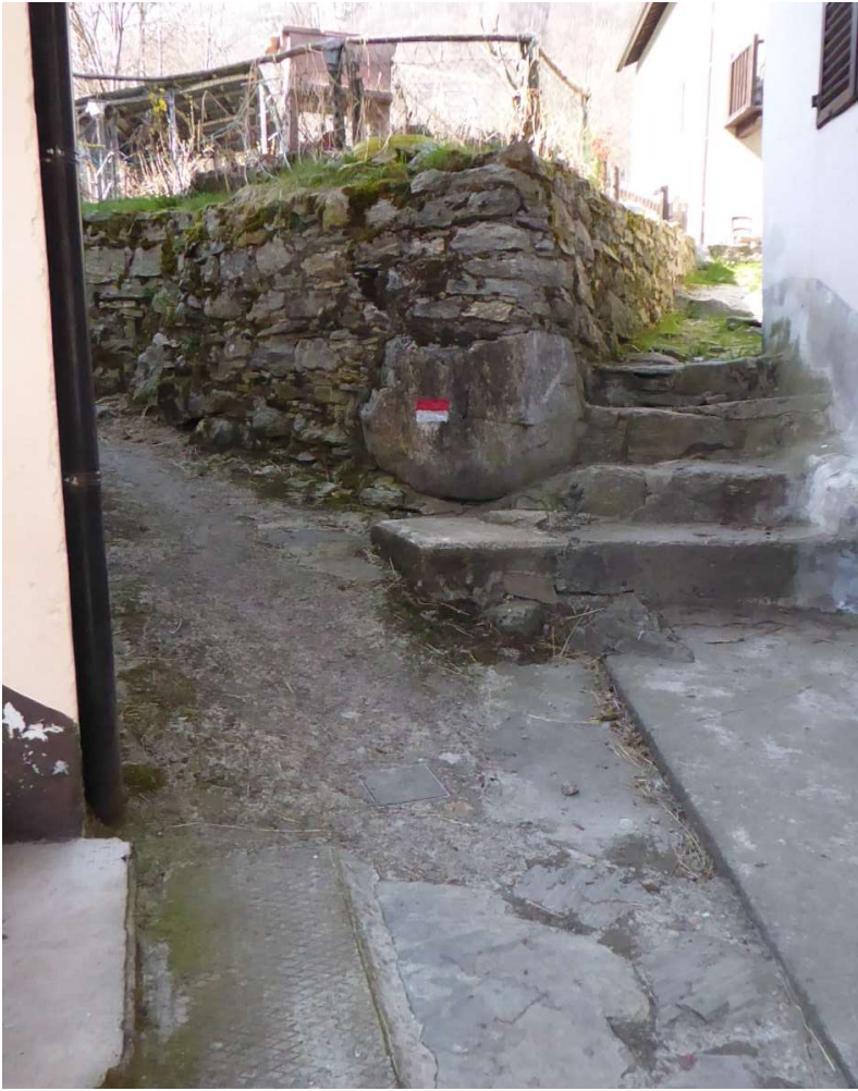
Il sentiero all' interno della prima borgata (bivio si va a sinistra)